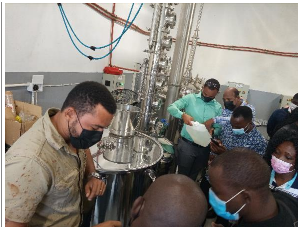
Visita de Intercâmbio com Unidades de Saúde do Ouro Verde