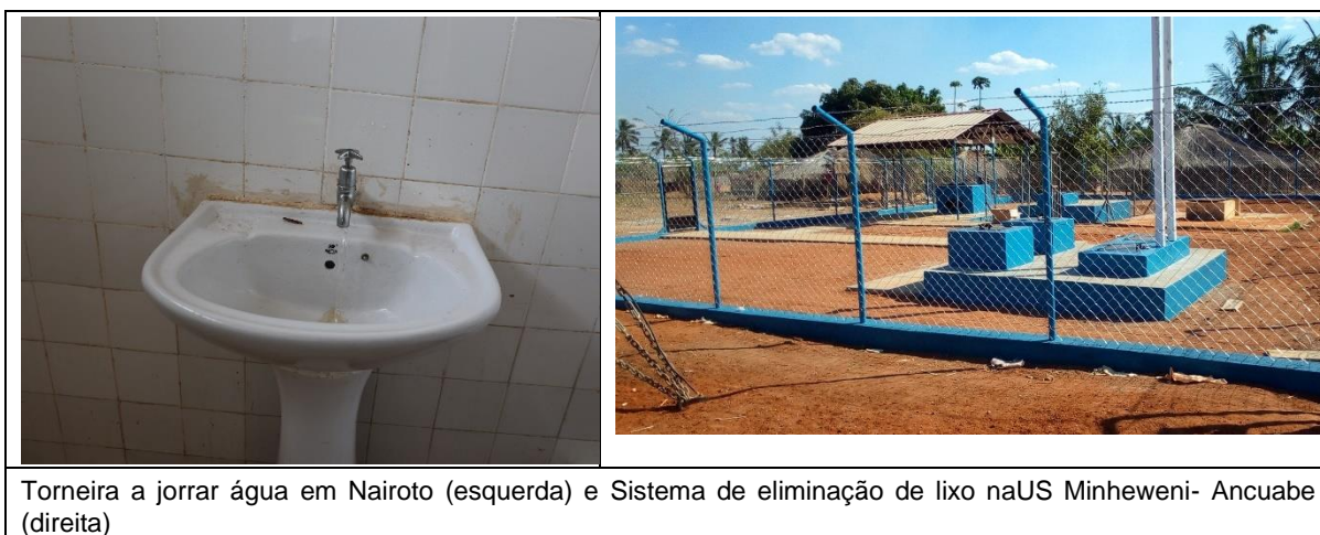
Torneira a jorrar água em Nairoto (esquerda) e Sistema de eliminação de lixo naUS Minheweni- Ancuabe (direita)

acompanhantes em Metoro, reabilitação da maternidade de Mariri, construção de sistema de água, sistema de eliminação de lixo e mudança de porta da maternidade de Minheweni. Mais detalhes no anexo 6.