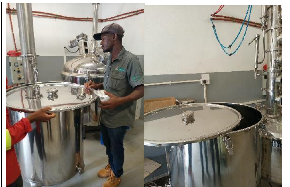
Destilação de álcool medicinal na fábrica da Ouro verde

Até à data, a fábrica de álcool medicinal da EcoEnergia funcionava experimentalmente num único turno de trabalho. Foram produzidos 5.000 litros de álcool medicinal e disponíveis para comercialização. Destes, apenas 3.150 litros foram vendidos principalmente para o voucher. Por outro lado, foram efectuadas 3 visitas para inspecção e controlo pelas autoridades locais (balcão único de serviço -BAU, Ministério da Indústria e Comércio e ANARME, à fábrica foram atribuídas as seguintes licenças: licenças industriais e sanitárias.